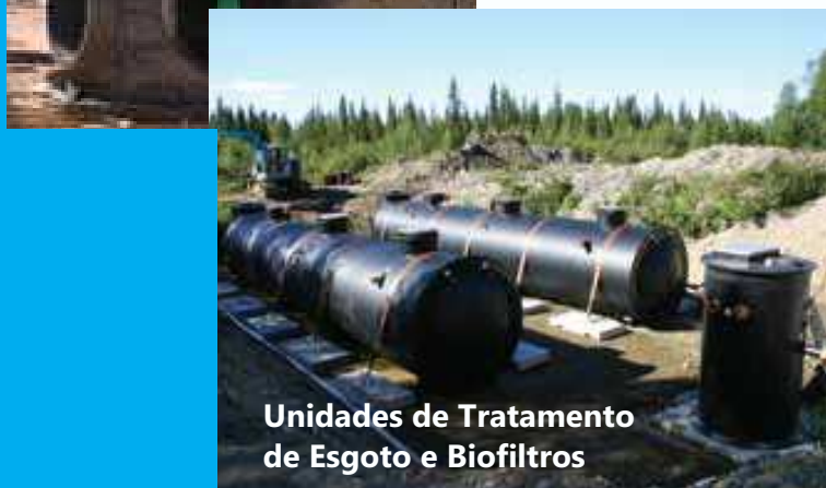
Unidades de Tratamento de Esgoto e Biofiltros