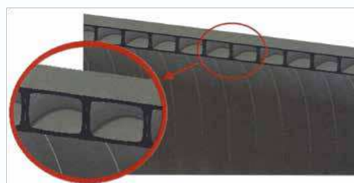
Detalhe do perfil KANAWEHOLITE

A KANAFLEX produz o tubo KANAWEHOLITE na Unidade de Embu das Artes /SP, a partir de um composto de polietileno de alta densidade, nos diâmetros que variam de DN/DI 800 até 3000 mm e podem ser fornecidos em classes de rigidez SN2 ou SN4. Os tubos são normalmente produzidos em comprimentos de 6 ou 12 metros, porém outros comprimentos podem ser fornecidos mediante consulta prévia. Os comprimentos dos tubos acabados têm uma tolerância de \pm 50 mm (23°C). O processo de fabricação é executado por extrusão. A parede do tubo KANAWEHOLITE consiste em perfis retangulares ocos, enrolados helicoidalmente, unidos através de soldagem, formando uma parede estruturada com superfícies externa e interna lisas, como se observa na figura abaixo: