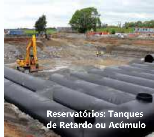
Reservatórios: Tanques de Retardo ou Acúmulo