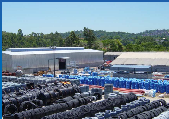
Unidade Matriz Embu das Artes / SP